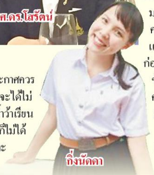
กิ่งนิตดา