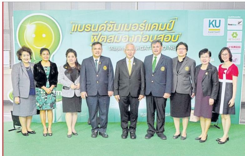
แบรนด์ซัมเมอร์แคมป์ : ศ.คลินิก นพ.อุดม คชินทร รัฐมนตรีศึกษาธิการ ปาฐกถาพิเศษ เรื่อง "นโยบายการศึกษาไทยยุคเศรษฐกิจดิจิทัล 4.0" ในงานสัมมนาวิชาการครูและอาจารย์ ทั่วประเทศจากโครงการแบรนด์ซัมเมอร์แคมป์ ครั้งที่ 30 ณ อาคารสารนิเทศ 50 ปี มหาวิทยาลัยเกษตรศาสตร์ บางเขน