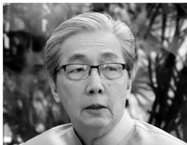
สมคิด จาตุศรีพิทักษ์

ภายหลัง “ประชาชาติธุรกิจ” เสนอข่าวการยุบรวมคณะกรรมาธิการสถานพลังประชารัฐ จาก 12 คณะเหลือ 3 กลุ่มไปแล้วนั้น เมื่อวันที่ 19 มกราคม 2561 นายสมคิด จาตุศรีพิทักษ์ รองนายกรัฐมนตรี แถลงข่าวภายหลังเป็นประธานการประชุมคณะกรรมาธิการสถานพลังประชารัฐ ว่าคณะทำงานสถานพลังประชารัฐยังคงดำเนินตามแผนงาน และจะประชุมทุกเดือนทั้งหัวหน้าทีมภาครัฐและเอกชน เพื่อรายงานความคืบหน้าต่อ พล.อ.ประยุทธ์ จันทร์โอชา นายกรัฐมนตรี โดยวางเป้าหมายตามยุทธศาสตร์ 3 ด้าน ประกอบด้วย 1.ความเหลื่อมล้ำ โดยมีทั้งเกษตร ท่องเที่ยว อีคอมเมิร์ซ 2.นโยบาย Thailand 4.0 สร้าง startup และ SMEs และ 3.พัฒนาคน การศึกษา และแรงงาน ทั้งนี้กลุ่มประชารัฐเพื่อสังคมยังคงมีอยู่เช่นเดิม