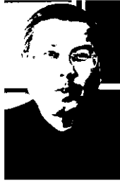
สุภัทร จำปาทอง

■...แวดวงราชภัฏ กับเรื่องราวร้อนระอุกันทั่วสถาบันอุดมศึกษาทั้งรัฐและเอกชน เมื่อ ดร.สุภัทร จำปาทอง เลขาธิการ กกอ.เปิดมติคณะกรรมการการอุดมศึกษา เรื่อง จำนวนและคุณสมบัติของอาจารย์ และ การบริหารหลักสูตร ในสถาบัน ที่ไม่เป็นไปตามมาตรฐานของการประเมินคุณภาพการศึกษาภายใน เฉพาะในส่วนขององค์ประกอบที่ 1 และมีจำนวนสถาบันอุดมศึกษาที่อยู่ในประกาศจำนวน 40 แห่ง